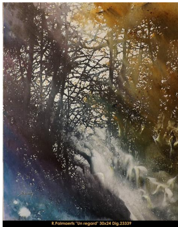
R. Palmaerts "Un regard" 30x24 Dig.23339