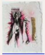
Le petit déjeuner