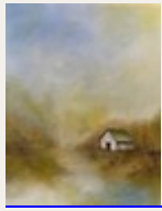
Dans la brume