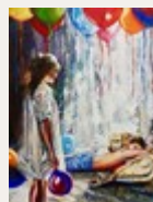
Rêvez en flânant