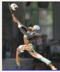
Géant Farfelu 1