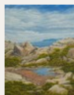
Assis sur ma roche