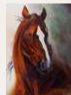
Beauté classique Sun Dancer