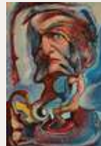
Géôle ou géôlier