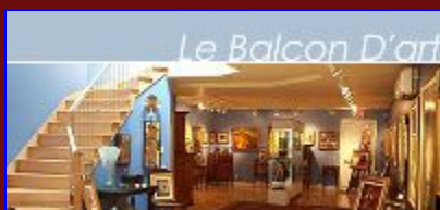
La galerie «le Balcon d'art», de St-Lambert