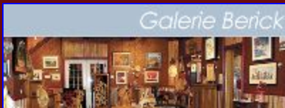
La Galerie Berick, de Bromont