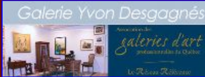
La Galerie Yvon Desgagnés, de Baie-Saint-Paul