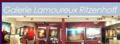
Les galeries Lamoureux Ritzenhoff, de Montréal