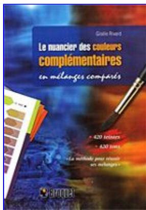
Le nuancier des couleurs