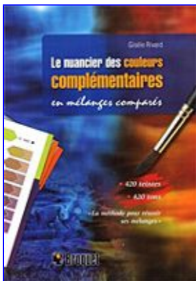
Le nuancier des couleurs