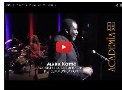
Discours de monsieur le ministre de la culture et des communications, Maka Kotto