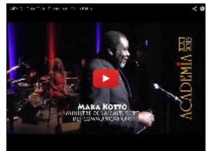
Discours de monsieur le ministre de la culture et des communications, Maka Kotto