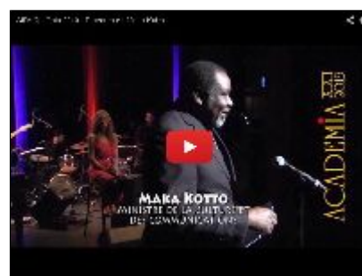
Discours de monsieur le ministre de la culture et des communications, Maka Kotto