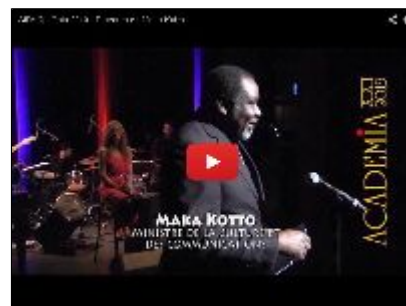
Discours de monsieur le ministre de la culture et des communications, Maka Kotto