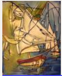
Pensées dans les voiles