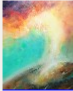
Retour aux sources