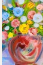
Expression florale No.5